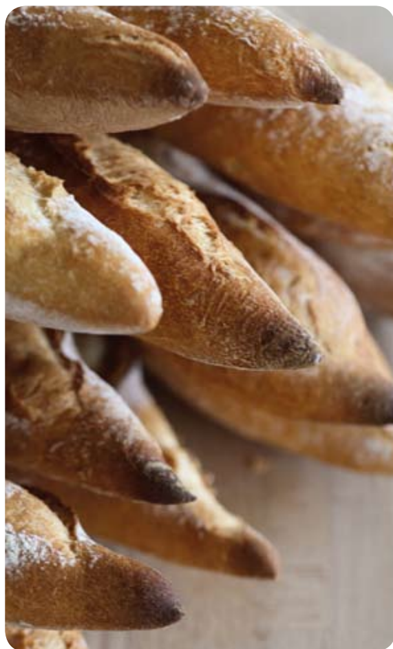
La Banette Fermentation Primeur

Le Marché aux Saveurs , des pains aux recettes originales réalisés à partir d'une farine de la gamme Banette. Ces exclusivités Banette révèlent tantôt des parfums du terroir, tantôt des saveurs du soleil : les Banetilles, Banette Bel Orient et Banette Médiéval.