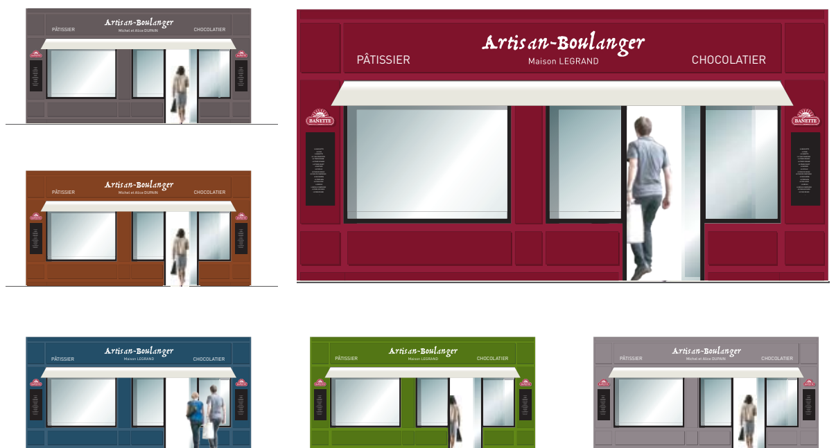
Des façades personnalisables pour être « chez soi ».

C'est dans cette optique qu'a été développé, par l'agence Saguez & Partners, un nouveau concept de boulangeries . Coloris de façade, agencement intérieur, présentation des produits... tout a été repensé dans un esprit résolument moderne, alliant fonctionnalité et esthétique. Les designers ont privilégié la visibilité du travail du boulanger, tout en s'attachant à faciliter ses conditions de travail. L'espace valorise également l'immense variété de la gamme Banette, et permet la dégustation.