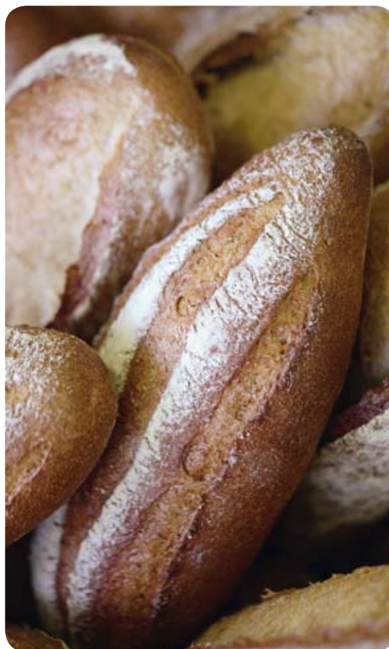
Le complet Banette