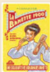
La Banette 1900 Tradition Française