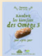
La Banette Cœur de Lin