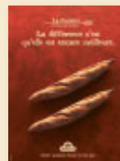
La Banette Fermentolyse

Tous ces pains bénéficient d'outils de communication incitatifs (plv, dépliants) qui vous facilitent le travail pour les faire découvrir à vos clients.