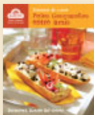
La Banette Bel-Orient