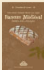
La Banette Médieval